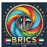
КЛУБ БРИКС ОАЭ.