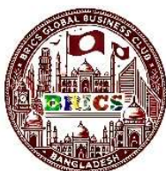
КЛУБ БРИКС Бангладеш