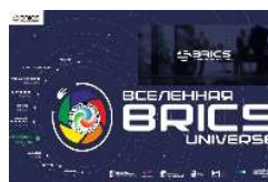
КЛУБ БРИКС Турция.